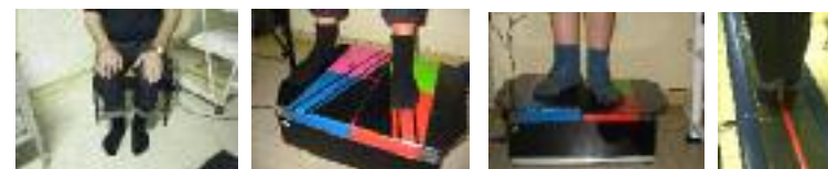
Tipi di stabilometria: in posizione seduta, monopodalica, calibrata, standard

Il laboratorio fa parte del progetto vertigo ( http://www.progettovertigo.com/ ) ed è censito dalla S.I.A.M.O.C (Società di Analisi del Movimento in Clinica, http://www.siamoc.it/ ) tra i laboratori nazionali ed europei per lo studio del movimento. La struttura di otoneurologia aderisce alla Società Italiana di Vestibologia.